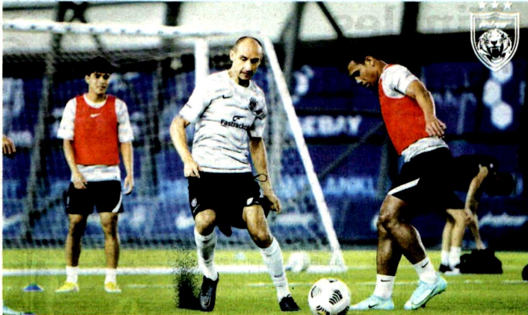
PEMAIN JDT menjalani latihan akhir di Johor kelmarin menjelang pertemuan menentang Petaling Jaya City di Stadium Petaling Jaya malam ini.