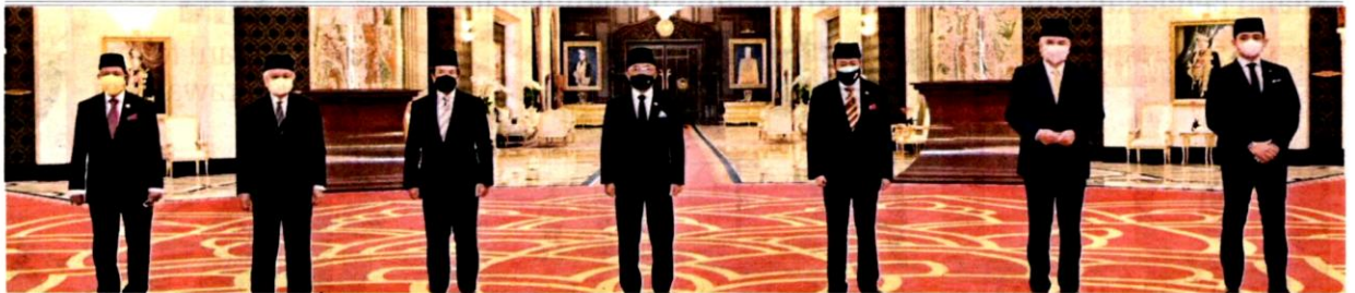
Al-Sultan Abdullah (tengah) berkenan hadir mempengerusikan Perbincangan Khas Majlis Raja-Raja di Istana Negara, semalam. Turut berangkat (dari kiri) Sultan Kedah, Al Aminul Karim Sultan Sallehuddin Sultan Badlishah; Yang di-Pertuan Besar Negeri Sembilan, Tuanku Muhriz ibni Almarhum Tuanku Munawir; Sultan Terengganu, Sultan Mizan Zainal Abidin; Sultan Selangor, Sultan Sharafuddin Idris Shah; Sultan Perak, Sultan Nazrin Muizzuddin Shah dan Pemangku Raja Pahang, Tengku Hassanah Ibrahim Alam Shah Al-Sultan Abdullah Ri'ayatuddin Al-Mustafa Billah Shah.