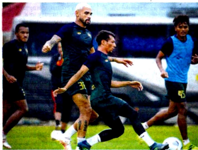
Pemain Kedah FC menjalani latihan bagi menghadapi TFC malam ini.

Namun, laluan skuad Bos Gaurus bukan mudah kerana skuad Red Giants kini berada pada prestasi meyakinkan selepas merekodkan kemenangan bersih dalam tiga aksi terakhir mereka.