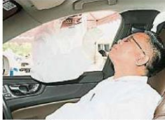
所有州议员获安排于周五进行新冠病毒筛检，惟今次与以往不同的是，州议员可采取下车方式检测。