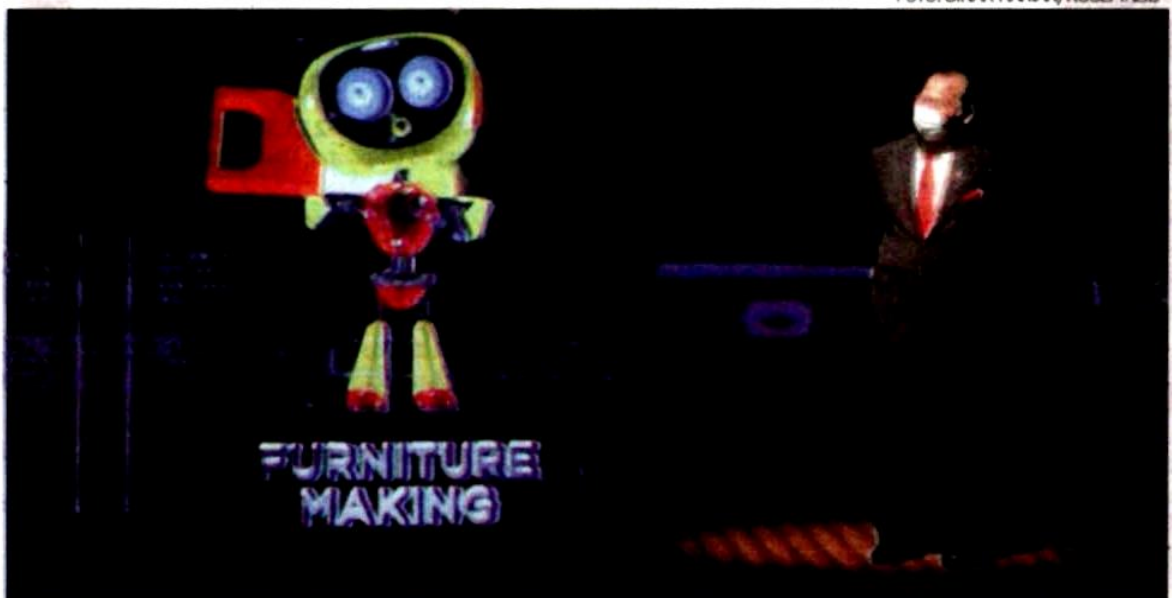
Khairuddin menyaksikan gimik pelancaran program Selangor Youth Skills 2021 di Bangunan SSAAS, pada Jumaat.