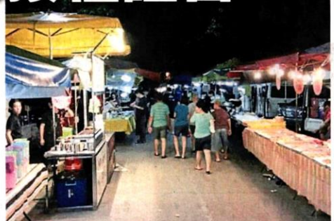
雪隆地区夜市获准营业，但必须遵守标准作业程序。(档案照)

于目前疫情严重，难免也让一些小販却步，未必会先开业，暂时观望。 他们说，有的小販可能还未完成第2剂疫苗接种，也不符合开业的条件。 料開業小販少50% “加上限制必需品才可开摊，我们估计开业小販可能少了50%，暂时也不确定，待开业后才掌握数据。” 无论如何，他们认为现在疫情严重，可能光顾的人潮不如从前，但有的小販想到至少可营业，帮补生计。 他们强调，开业小販都有严厉遵守标准作业程序，包括安排志愿警团在外维持秩序，及检查到访者的电子疫苗接种证书。 随着顾客必须电子疫苗接种证书，夜市也不再使用手写登记，所有顾客都必须使用手机签到，并出示接种证明。