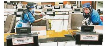
工作人员积极消毒所有州议员的座位。

对于州议会的餐桌，每桌同时只能允许两人用餐；州议会也会提供饭盒给公务员和媒体从业员。公务员用餐时，会安排在州议会大厦底层，以免议会大厦有聚群感染风险。